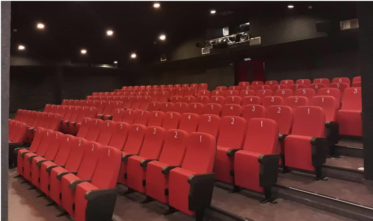
CINEMA MULTISALA PAOLILLO BARLETTA | ITALIA