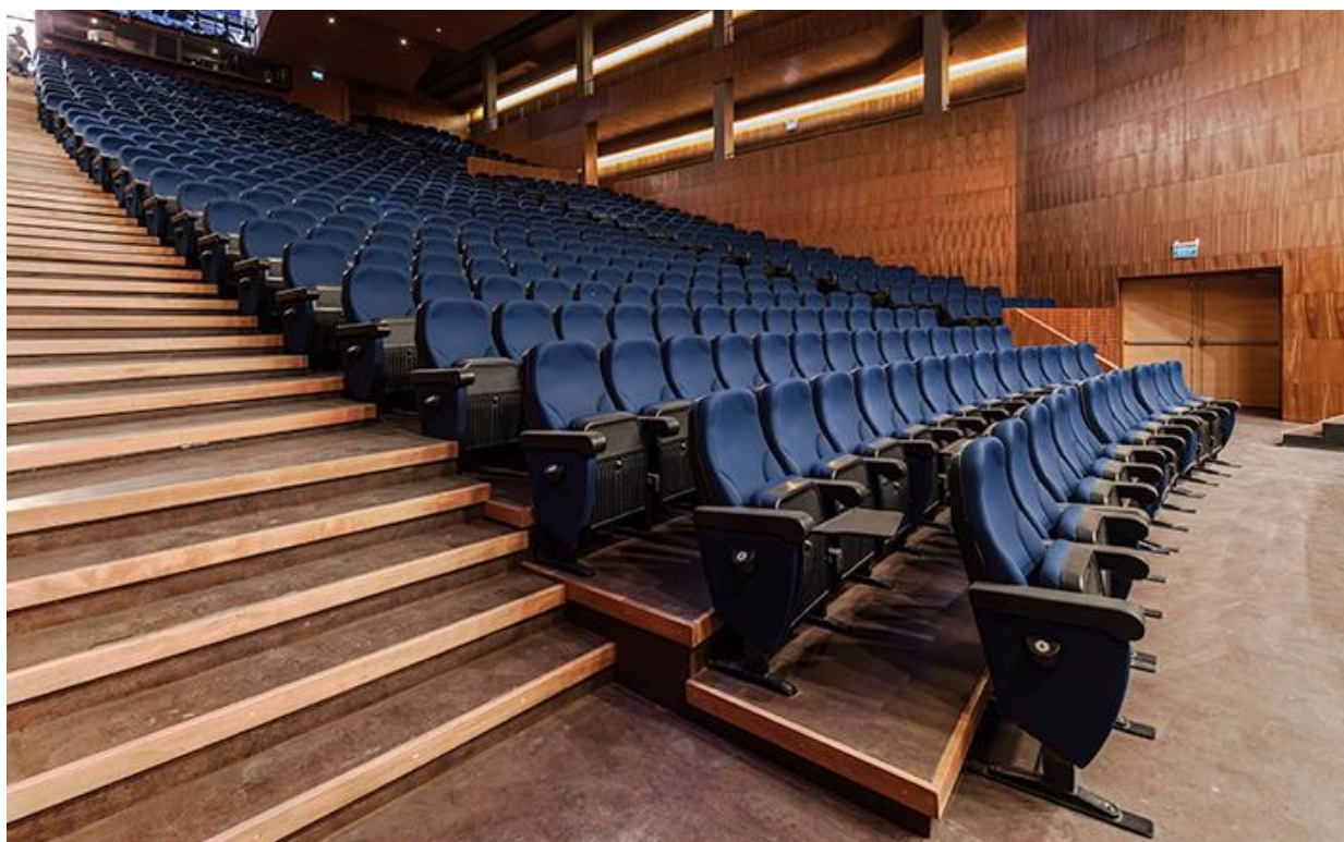
TEATRO INTERNATIONAL SCHOOL NIDO DE AGUILAS SANTIAGO | CHILE