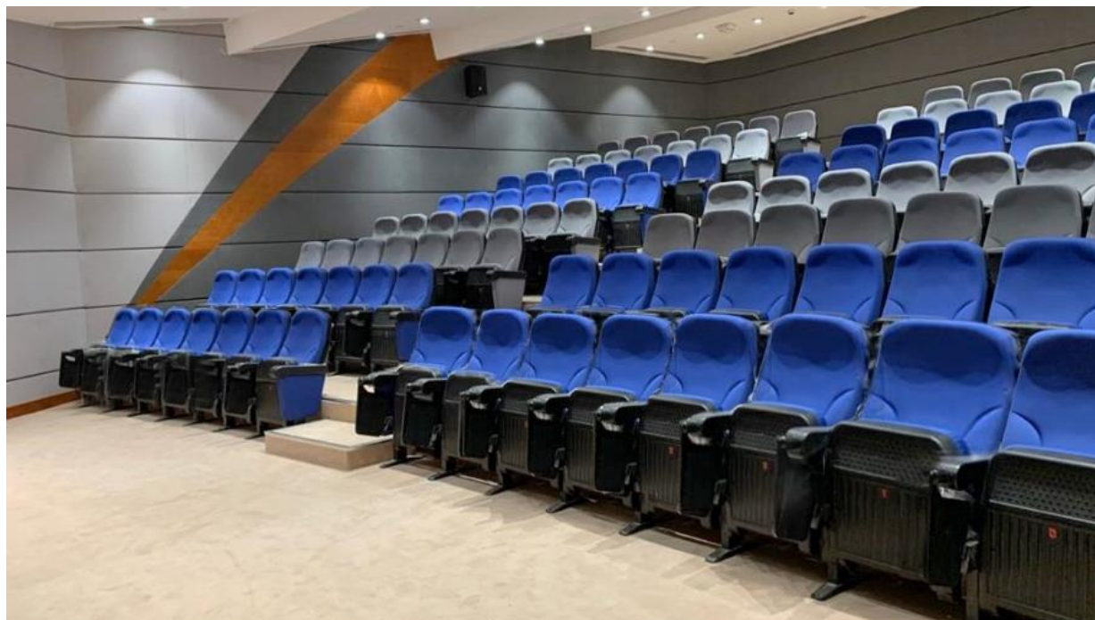
SALÓN DE ACTOS NAJRAN UNIVERSITY NAJRAN | ARABIA SAUDÍ