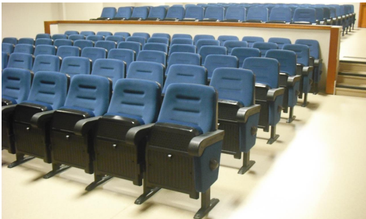
SALÓN DE ACTOS COL·LEGI SALESIANS HORTA BARCELONA | CATALUÑA | ESPAÑA