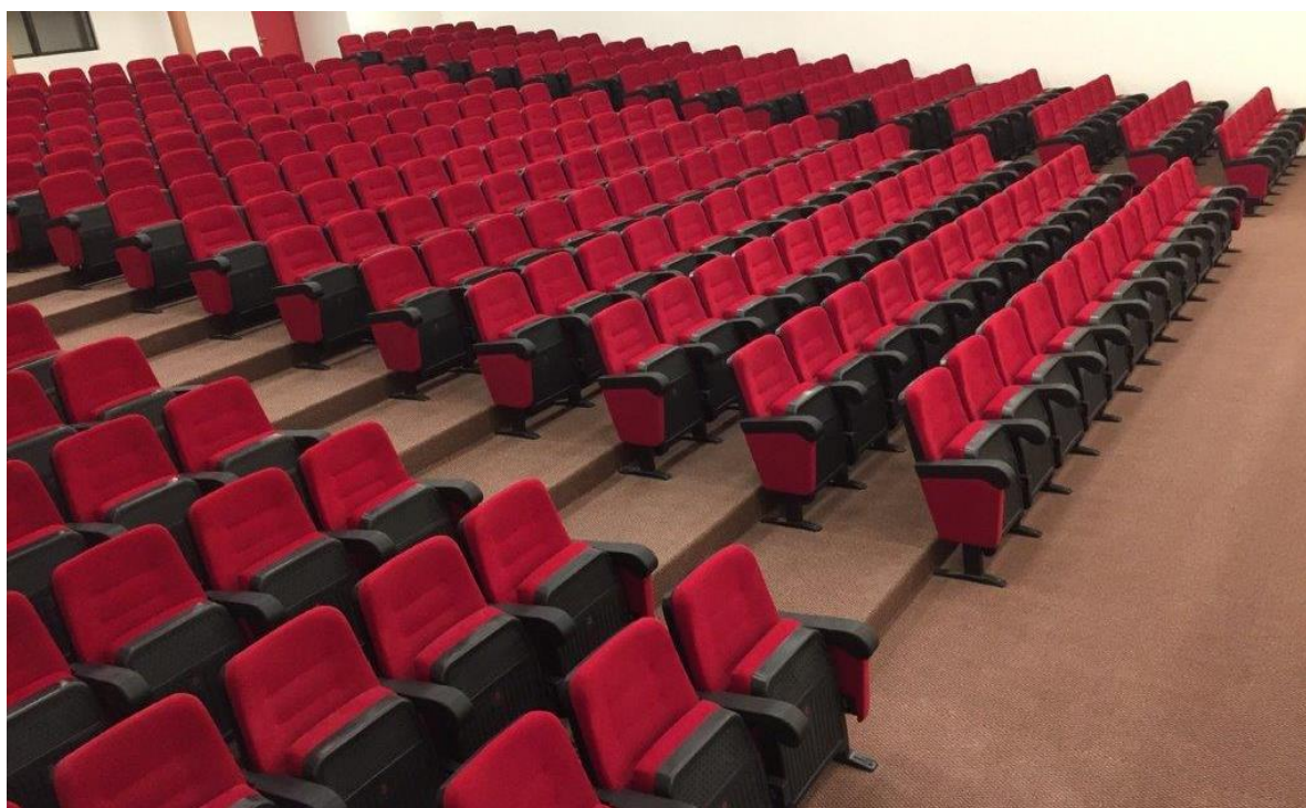
SALÓN DE ACTOS REDLAND SCHOOL LAS CONDES | SANTIAGO | CHILE