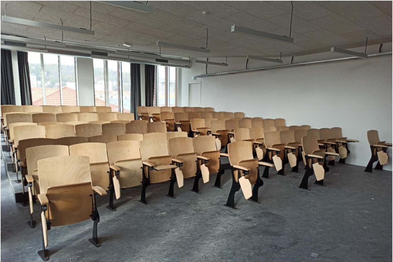
L'UNIVERSITÉ JEAN MONNET CENTRE DES SAVOIRS SAINT-ÉTIENNE | FRANCIA