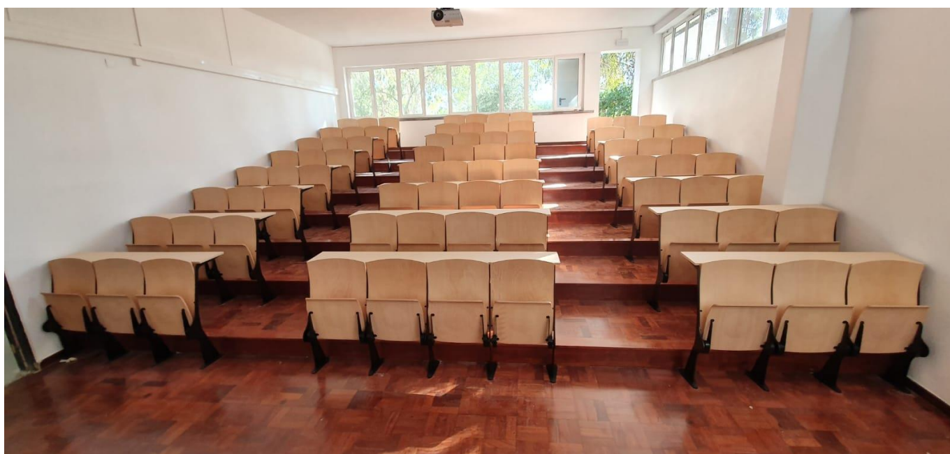
AULA COLEGIO VALSASSINA LISBOA | PORTUGAL