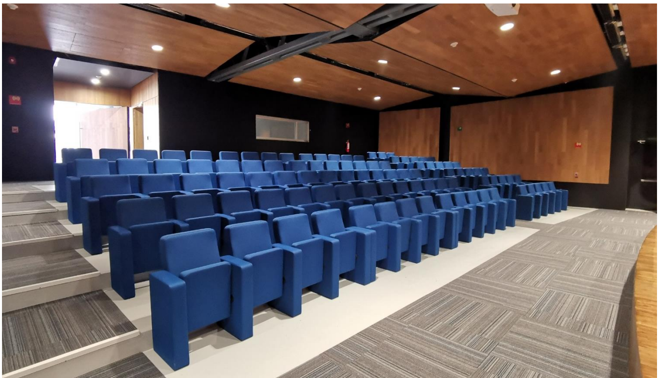
SALA CONFERENCIAS HRM RHEINMETALL QUERÉTARO | MÉXICO

Para Radio Menor de 10 metros las butacas se implantan con doble brazo (Individuales)