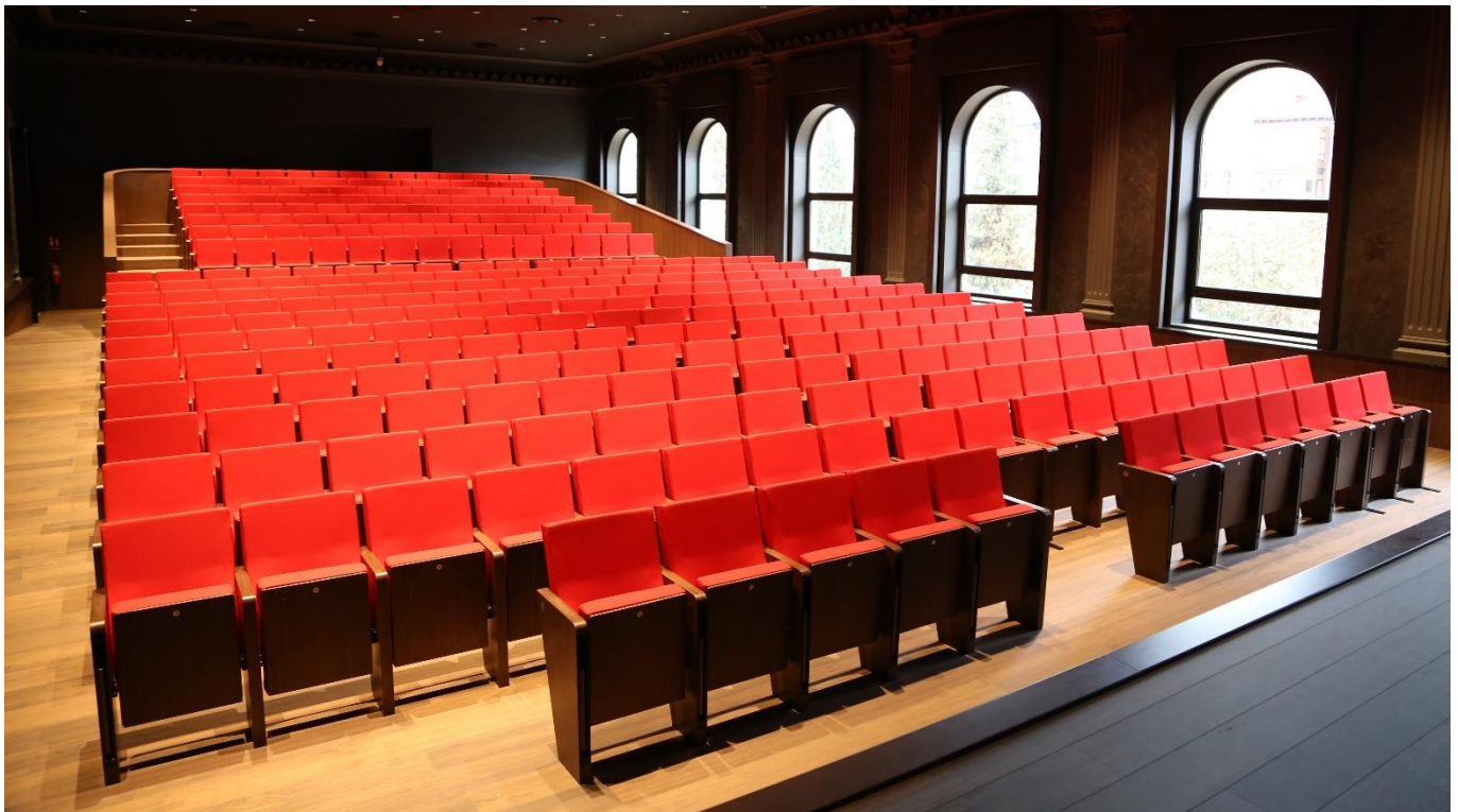
SALÓN DE ACTOS I.E.S. PRÁXEDES MATEO SAGASTA LOGROÑO | LA RIOJA | ESPAÑA