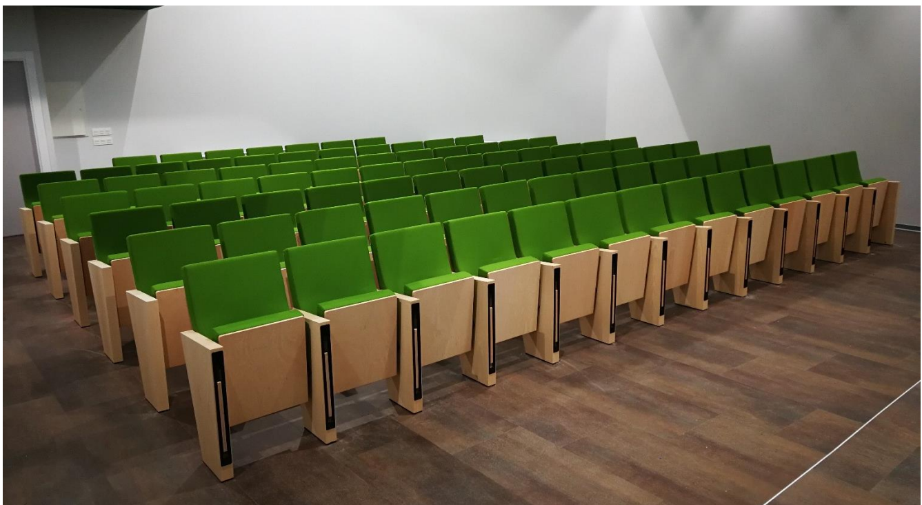
SALÓN DE ACTOS FACULTAD DE VETERINARIA DE LA UNIVERSIDAD DE LEÓN LEÓN | CASTILLA LEÓN | ESPAÑA