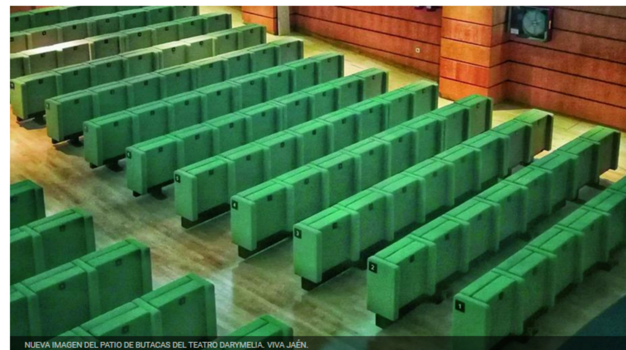
NUEVA IMAGEN DEL PATIO DE BUTACAS DEL TEATRO DARYMELIA. VIVA JAÉN.

El patio de butacas es móvil, pero la inclinación de más de un 3% del suelo no permite su uso para actos con público de pie